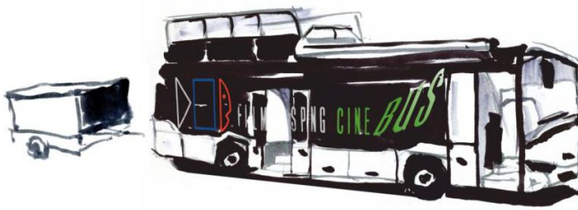
W przyczepie agregat i dodatkowy bagaż.