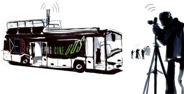
Bezprzewodowe przesyłanie sygnału HD na odległość do 300 m. (2 kanały).