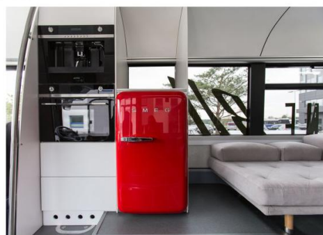
Zapraszamy na kawę. Także mikrofalówka.