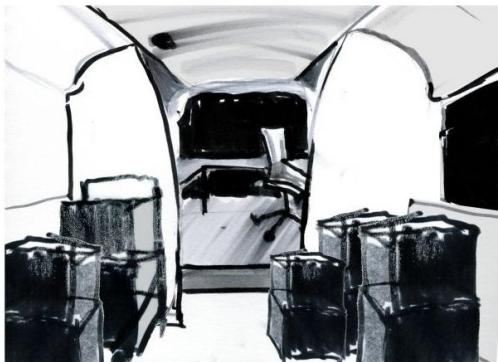
Składane stoły (wszystkie) powiększają przestrzeń ładunkową.