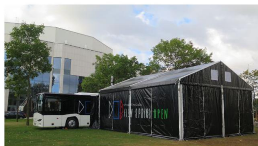
Projekcja, studio bluescreen, magazyn.