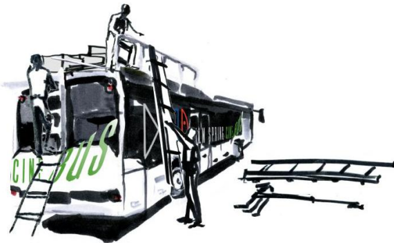
Nośność bagażnika do 1000 kg.