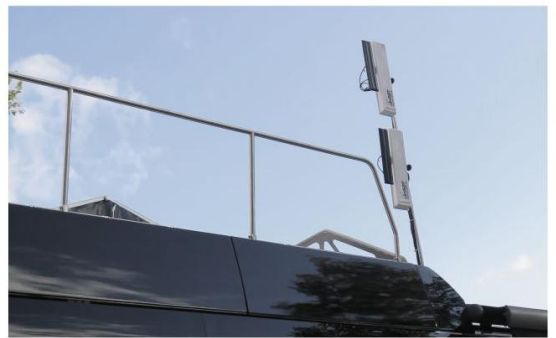
Odbiornik sygnału z kamer. W przyszłości mobilna stacja BTS.