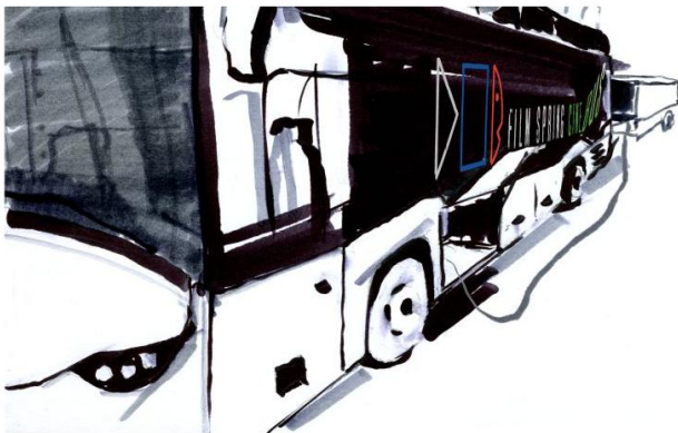
Po obu stronach przestrzeń bagażowa w lukach.