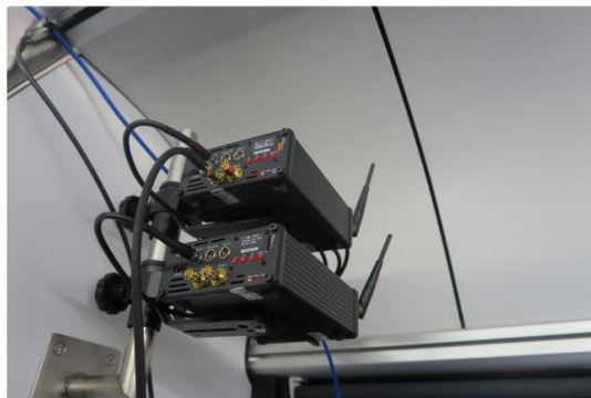
Obraz z odbiorników poprzez sieć światłowodową trafia do wszystkich komputerów na pokładzie.