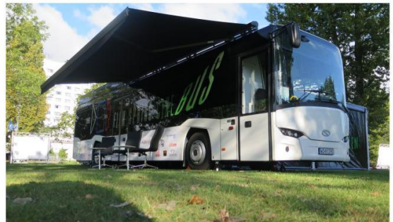
Markiza poszerza przestrzeń roboczą. Chroni sprzęt przed deszczem.