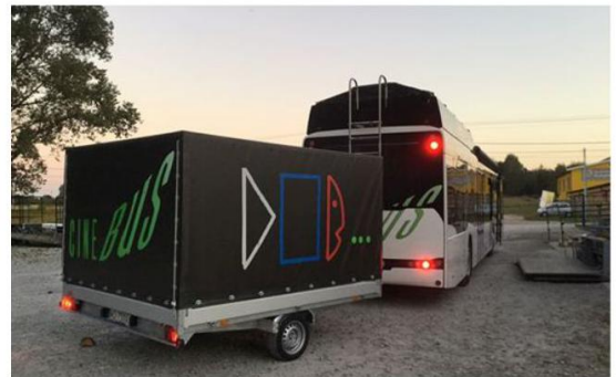
Spakowany namiot na dachu.