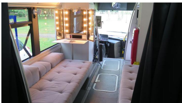
Część aktorska z make up i szafą na kostiumy.