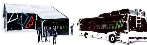
Cinebus po zdjęciach dokuje do namiotu.