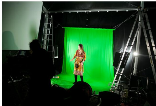
Studio greencrenowe w namiocie.