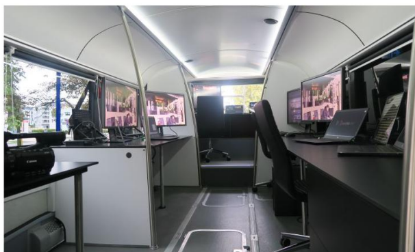
Archiwizacja, montaż, CGI, korekcja barwna.