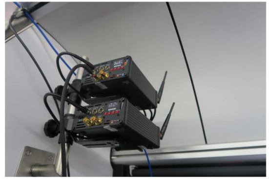
Obraz z odbiorników poprzez sieć światłowodową trafia do wszystkich komputerów na pokładzie.