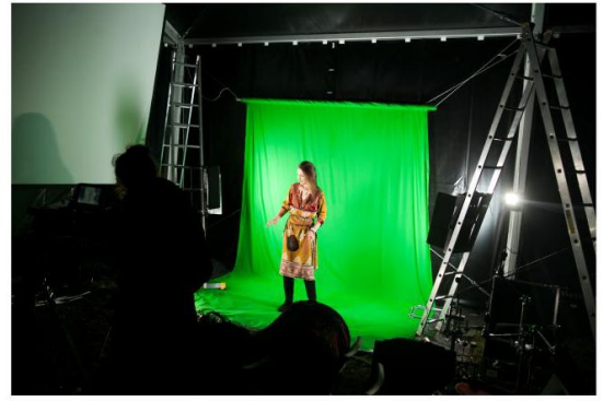
Studio greencrenowe w namiocie.