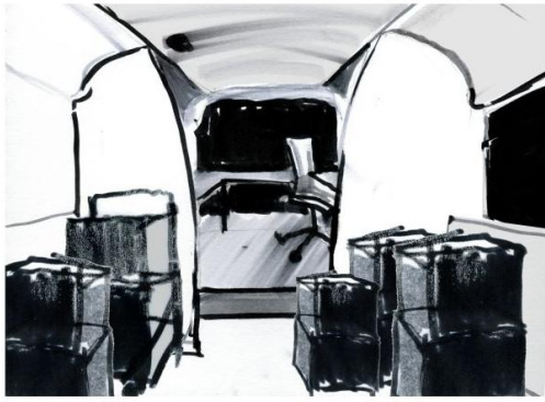
Składane stoły (wszystkie) powiększają przestrzeń ładunkową.