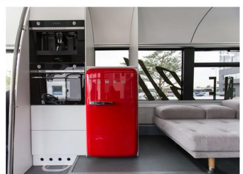
Zapraszamy na kawę. Także mikrofalówka.